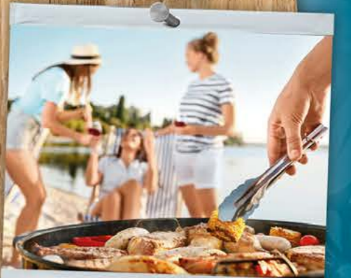
Vier de zomer